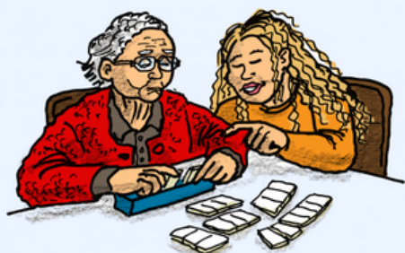
Persoonlijke begeleiding of dagbesteding